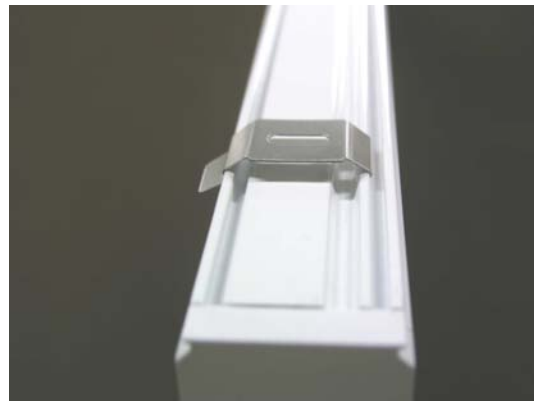
Anlage mit Bedienung links